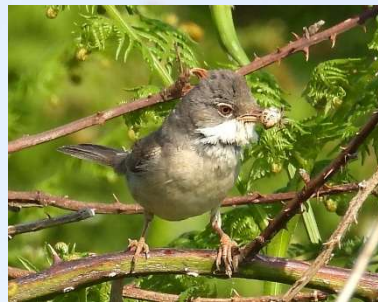
Tornsanger med edderkop.

Der var godt gang i ynglefuglene. Mange Tornsangere var ved at fordre unger. Hættemågerne var stadig aktive i kolonien ved udstillingshuset.