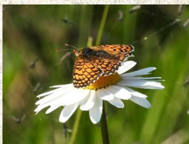
Hvid Okseøje med Okkergul Pletvinge.

I de sædvanlige vandhuller var der mange kransnålalger. Der blev set mange tætte klumper af grønalger i vandhullerne og i det lave vand ved kysten. På grund af det tørre vejr var mosserne ikke iøjnefaldende.