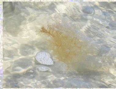
Vist en af de tynde, buskformede Rødalger.

Blæretang var den eneste brunalge, jeg lagde mærke til. Af rødalger var der Gaffeltang plus en tynd buskformet art.