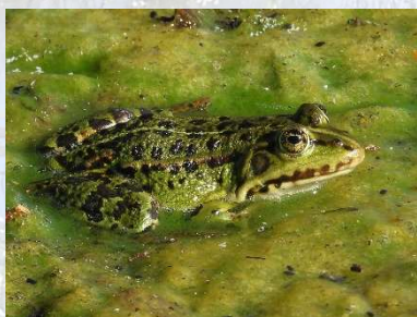
Grøn Frø på Grønalger.

Ingen repræsentanter for nye hovedgruppe blev fundet i dag. I dag så jeg kun repræsentanter for 10 (11) af de 25 (26) hovedgrupper af organismer nævnt i Livstræet: Brunalger, Grønalger, Kransnålalger, Mosser, Bregner, Frøplanter, Svampe, Padder, Fugle, Pattedyr og Insekter. Kransnålalger er ikke nævnt som selvstændiggrupper og står derfor i parentes.