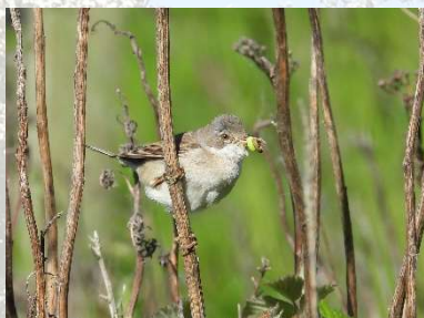
Tornsanger med føde til unger.

Af padder var især Grøn Frø i gang med at kvække. En enkelt Klokkefrø blev set.