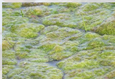
Grønalger i vandhul.

Af rødalgerne blev der set den sædvanlige Gaffeltang og nogle af de tynde, fingreformede typer.