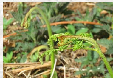
Ørnebregdens blade var ved at folde sig ud.