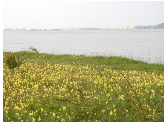
Hulkravede Kodrivere på Avnø.

DN Vordingborg har hermed fornøjelsen at sende jer et nyhedsbrev. Der fortælles om nyheder fra den seneste tid og begivenheder de kommende måneder.