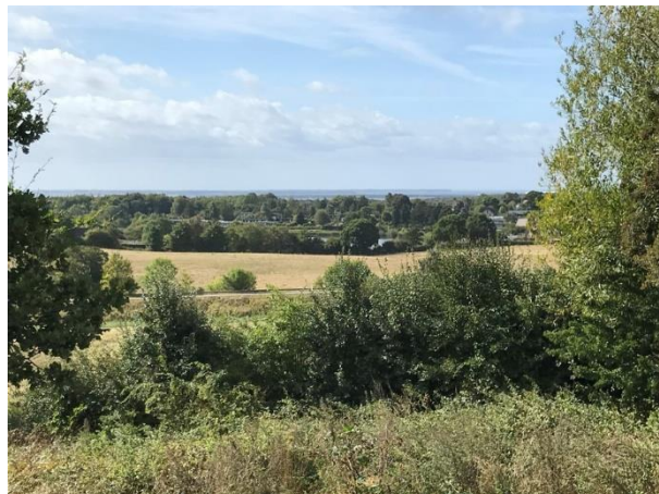
Udsigt fra Munks Banke mod den omtalte mark. Hulemosesøen ses i baggrunden.

Naturfredningsforening argumenterede over for Vordingborg Kommune for, at marken nord for søen ikke skulle bebygges, da søen så ville miste sin landskabelige tilknytning til bakkelandet mod nord, blandt andet Munks Banke. Samtidig undgik man, at villaområdet smeltede sammen med den eksisterende udstykning omkring Hulemosevej og Søbakken. Endelig blev det besluttet at trække villabebyggelsen øst for Hulemosesøen tilbage, så der ikke blev bygget helt tæt på søen. Det var et kompromis, vi kunne leve med.