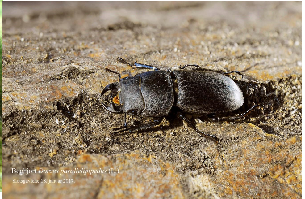
Bøghjort Dorcus parallelipedus (L.) Slotsgravlene 18. januar 2017.